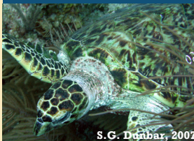
S.G. Dagar, 2007

Cuba ha prohibido la captura de tortugas marinas a través de una Resolución Ministerial, aprobada en enero del 2008. Esto pone fin a una prolongada captura de 500 tortugas carey/año, una especie en peligro crítico de extinción. Beneficiará a las tortugas que desovan en playas del Caribe y que regularmente se alimentan en aguas cubanas. Esta es un esfuerzo conjunto del Ministerio de Industria Pesquera y WWF, con apoyo económico de la AIDC. www.panda.org