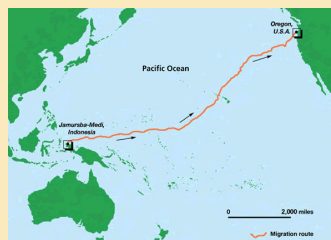
Mapa: Stephen Nash / Conservation International

grande de anidadoras en el Pacífico, migran a través de los Filipinos, Mar de Sur de China y Japón, hasta el hemisferio sur. De nuevo nos demuestra la urgencia para proteger la laúd del Pacífico por medio de cooperación internacional. www.seaturtlestatus.org .