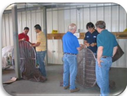
Aprendiendo como armar los DETs

El objetivo fué entrenar un equipo de expertos en tecnologías DET en Centroamérica que trabajaran con el gobierno y la industria para mejorar sus programas nacionales. Los "estudiantes" llegaron de las diferentes oficinas de pesca de 5 países Centroamericanos (Costa Rica, Panamá, El Salvador, Nicaragua, y Honduras). Entre los invitados especiales estaban la directora de Pesca de El Salvador y la Secretaria PT de la CIT.