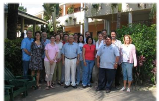
Miembros del CCE durante su 3ra Reunión en Belice.

El IV Simposio Regional de Tortugas Marinas en el Pacífico Sur Oriental se llevará a cabo del 25 al 26 de noviembre del 2010 en Medellín, Colombia. Para mayor información visite el sitio web: www.iiicongresocolombianozoología.org