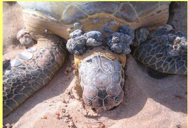
Tortuga verde con fibropapilomas.

En general, existe un vacío de conocimiento sobre los efectos nocivos de la polución del mar y de la zona costera. Sin embargo, en algunos mamíferos marinos se ha observado que la bio-acumulación de metales pesados o plaguicidas está vinculada con la supresión inmunológica, exponiéndoles a enfermedades 7 . La misma preocupación es válida para el caso de las tortugas marinas. Estudios recientes también indican que la enfermedad que causa tumores, conocido como fibropapilomas, en las tortugas puede estar ligada a la polución de las aguas costeras o incluso del mar abierto.