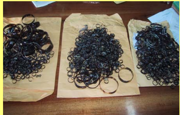
Productos de Carey.

Tradicionalmente las playas de desove se protegen de los saqueadores ilegales de huevos y de los cazadores de tortugas por medio de patrullajes de playa permanentes