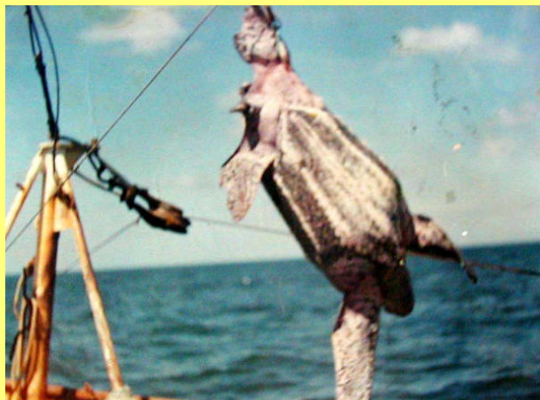
Dc capturado en pesquería de arrastre.

A pesar de que las tortugas marinas pueden sumergirse por largos periodos, las que están sumergidas por alguna causa ajena a su voluntad, eventualmente sufrirían consecuencias fatales de anoxia prolongada e infiltración de agua marina en los pulmones. Si su captura no produce la muerte y sobrevive, existe poco conocimiento sobre las tasas de supervivencia de las que se sueltan después de experimentar una herida en las extremidades por un gancho, mecate u otro tipo de equipo de pesca.