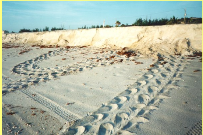
Relleno de arena, Jupiter Beach, Florida.

El desarrollo realizado en zonas costeras utilizadas por las tortugas marinas para su desove, es muchas veces incompatible con esta crucial etapa de su ciclo de vida. Construcciones y estructuras en las playas o en la zona adyacente, como rompeolas, relleno o extracción de arena y la eliminación de la vegetación natural de las dunas, promueve significativamente la erosión y afecta directamente las condiciones del hábitat necesario para las tortugas marinas. Por otro lado, la temperatura de la arena determina el sexo de los neonatos (en general, las temperaturas altas producen hembras mientras que las más bajas producen machos). En algunos casos, las construcciones altas o la destrucción de la vegetación litoral producen una variación en la temperatura de la arena, lo cual puede causar un sesgo en la distribución de los sexos. Muchas preguntas existen sobre los efectos del cambio climático mundial en las tortugas marinas; sus consecuencias pueden ser desde un cambio en la temperatura de la arena hasta un aumento en la tasa de erosión de las playas.