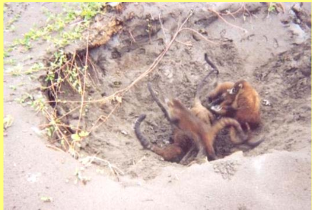
Coatis depredando un nido de tortuga verde en Tortuguero, Costa Rica.

Durante su existencia de millones de años, las tortugas marinas han sobrevivido varios cambios catastróficos, climáticos y geológicos, los cuales han provocado cambios drásticos a sus distintos hábitats. Además, las tortugas marinas, sus nidos y crías (neonatos) se enfrentan a numerosas amenazas todo el tiempo. Dentro del nido, los huevos y los neonatos enfrentan muchos depredadores como hormigas, cangrejos, y mapaches. Después de salir del nido, las tortuguitas enfrentan cangrejos, pájaros y depredadores dentro del mar (por ejemplo, peces y tiburones). Muy pocas, quizás solo una de cada 1.000 nacidas, podrán llegar a la madurez. Cuando son adultos, la cantidad de amenazas naturales disminuyen considerablemente y tienen muy pocos depredadores naturales en el mar y en la tierra, entre ellos los tiburones y los jaguares. Sin embargo, es el aumento de las amenazas generadas por los humanos, lo que ha puesto en peligro de extinción a estas especies, pues ponen presión adicional sobre cada etapa de su vida, desde su área de anidación hasta mortalidad en el mar abierto.