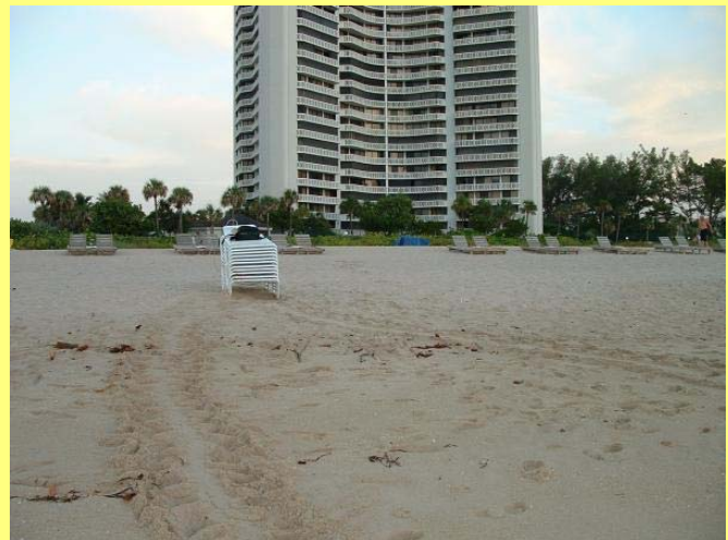
Sitio de anidación en Singer Island, Florida.

El desove de las tortugas se ha vuelto un gran atractivo para los visitantes de las zonas costeras. La participación de estos grupos para observar el comportamiento de las tortugas en las playas de desove es importante, ya que enriquece el conocimiento que se tiene de ellas, aumentando así la conciencia pública y el número de personas que las protegen y cuidan. Así mismo esta actividad es una fuente económica importante que genera empleo y divisas para la población local. Sin embargo, la presencia de los seres humanos en la playa puede ser dañina para