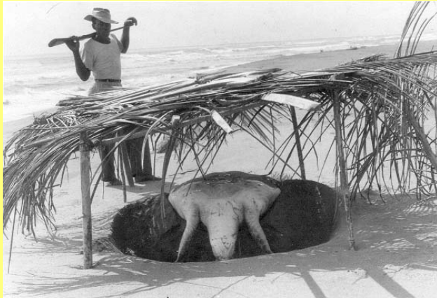
Caza de la tortuga verde. Tortuguero, Costa Rica.

por el Caribe, por tantas tortugas que allí había, como miles y miles de pequeñas rocas. De la misma manera, hasta hace poco la carne de la tortuga verde, los escudos de la carey y el cuero de la lora, entre otros, representaban rubros de exportación para muchas naciones. En el presente sería imposible, en casi todos los casos, pretender cosechar cantidades de tortugas marinas que pueden satisfacer los mercados mundiales, tal es la magnitud del colapso de sus poblaciones mundialmente, consecuencia del desmedido consumo a que éstas han estado sujetas.