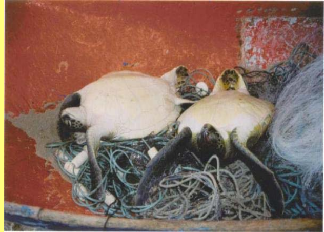
Tortugas verdes capturadas en redes de pesca.

Una gran cantidad de tortugas marinas son capturadas en varios tipos de redes y enganchadas en los anzuelos de los palangres durante faenas pesqueras dirigidas a otras especies (captura incidental). La información existente sobre este tema es escasa debido a que la mayoría de las actividades pesqueras no llevan registros sobre esta captura, salvo en el caso de la flota atunera del Pacífico. En el caso de esta flota, la Comisión Interamericana del Atún Tropical (CIAT) estima que solamente las pesquerías atuneras industriales en alta mar, calan unos 200 millones de anzuelos cada año en el océano Pacífico, donde reconocen que capturan tortugas incidentalmente 9 . Un estudio reciente sobre la captura incidental de tortugas laúd y caguama en palangres en el Pacífico, sugiere que ya se han excedido los números que permitirán una eventual recuperación de estas poblaciones amenazadas 10 .